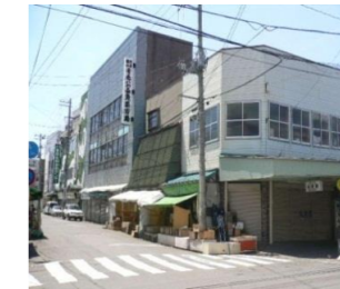
〔古川市場周辺地区〕

平成23年度 まちづくり協議会設立 平成25年度 解体作業を開始 平成27年度 着工予定 1階ポケットパーク、2階～15階マンション