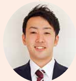
営業部 青森営業課（勤続6年）