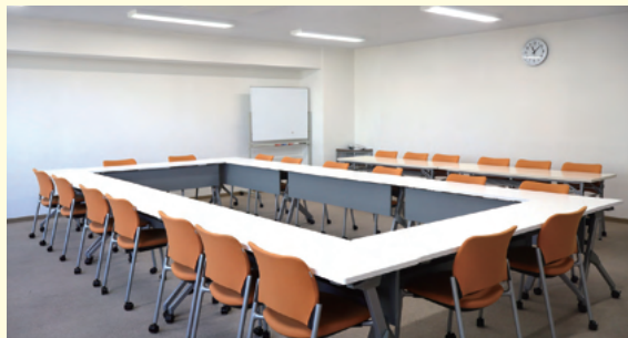
5Fミーティングルーム 1