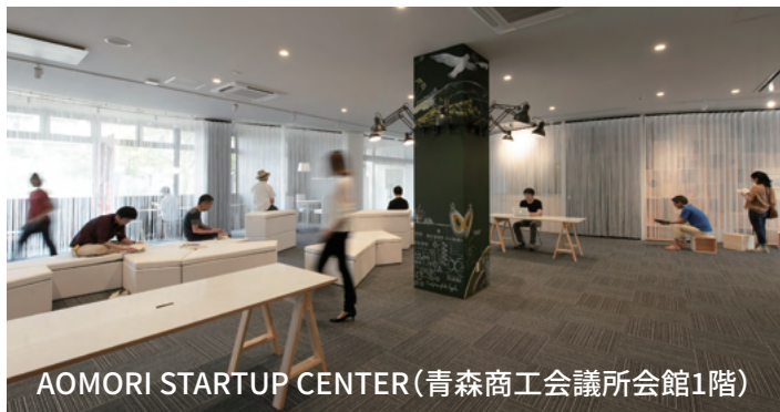
AOMORI STARTUP CENTER(青森商工会議所会館1階)